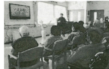
すでに介護現場で採用

回想法ではPepperと一緒に昔の絵などを見ながら会話することで、高齢者のコミュニケーション機会を創出。認知症予防効果も期待される。またPepperがレクリエーションを進行することで介護職員の負担軽減を図る。これまでに介護事業所で20回以