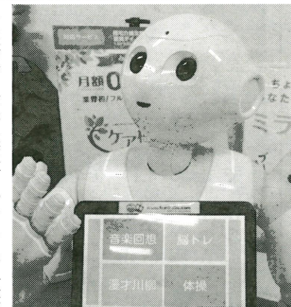
▲アプリはクラウドから取得

にも採択された。実証試験ではWHOの基準でアプリの効果を測り、その結果を元にさらに介護現場で役立つよう改善していくという。アプリはクラウドサービスと連携しており、定期的に更新される最新のコンテンツを利用できる。アプリ開発は各専門家との共同研究により進めている。さらに、介護業務支援システムのケア樹との連携により、現場の業務効率化を加速させる。「ケア樹あそぶ for Pepper」の導入費用は、初期アプリ利用料5万円と月額1万円。また初期導入サポート費用は25万円、運用サポートは月額1万円となっている。